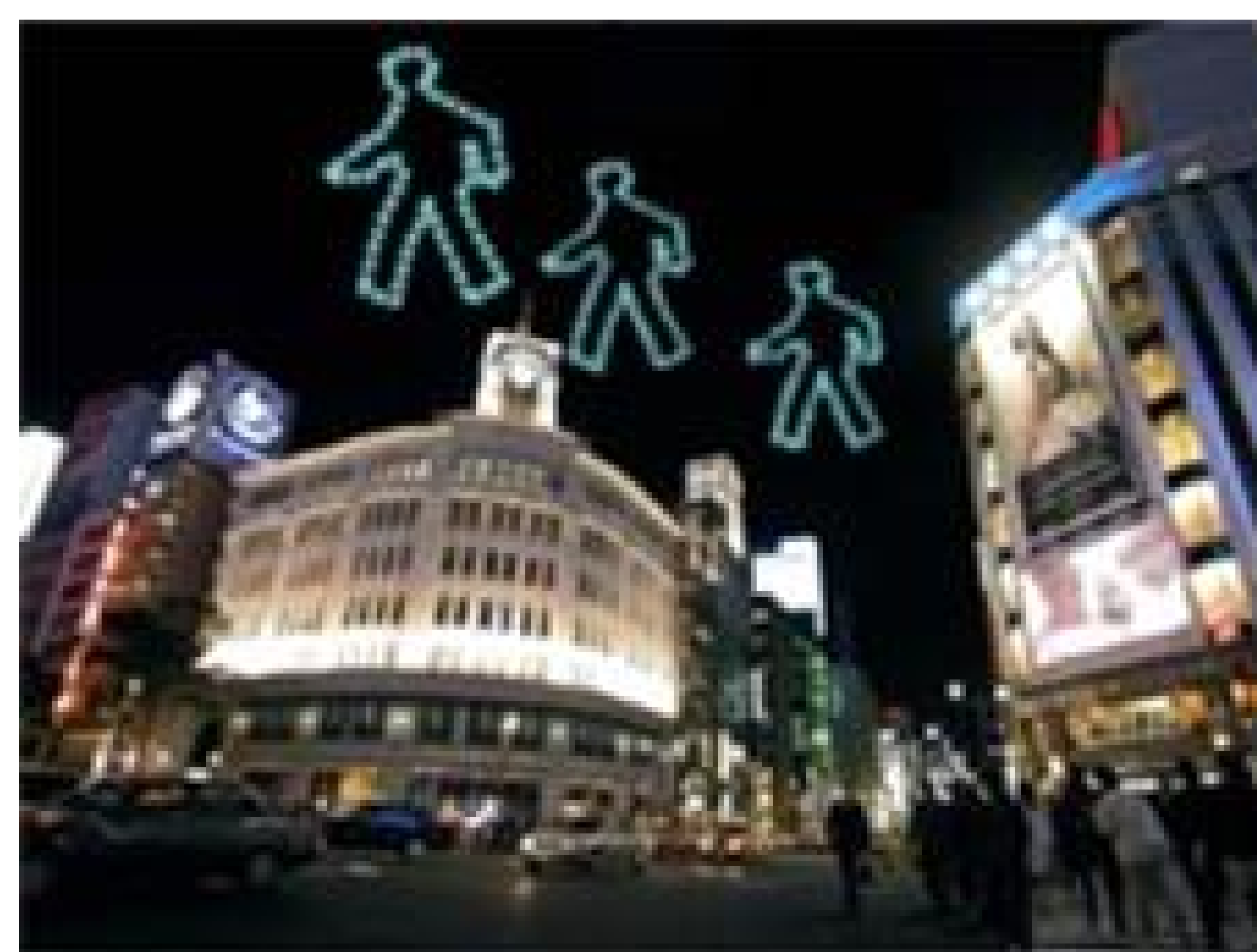
図1 Aerial 3D Display

ディスプレイやスクリーンが全く存在しない空間上に映像コンテンツを映し出す ことは長らく人類の夢であったが、近年、Aerial 3D Display（日本未来科学館3Dディスプレイプロジェクト、株式会社バートン）が発表され、その夢に一步近づく状況となってきた。Aerial 3D Displayは図1に示すように空間上に3D点描画を映し出す将来性の高いシステムであるが、現在は提示可能コンテンツは点描画に留まっている。