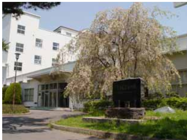
電気通信研究所玄関

(財)電気通信工学振興会は、昭和19年(1944年)12月11日に設立され、「電気通信工学に関する学術の研究並びにその教育を助成し、もって我国産業の発展に資する」ことを目的としています。