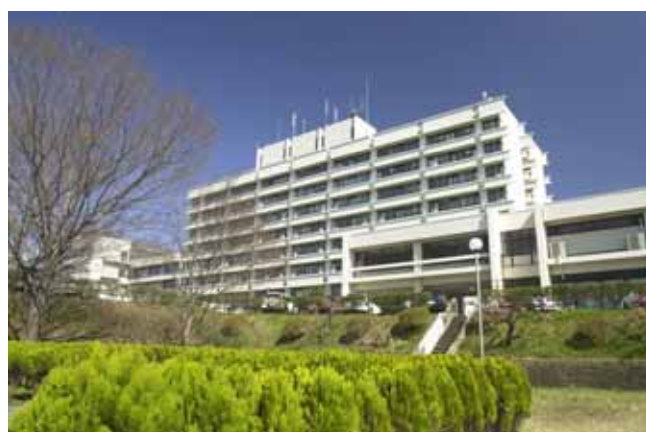
電気・情報系研究棟